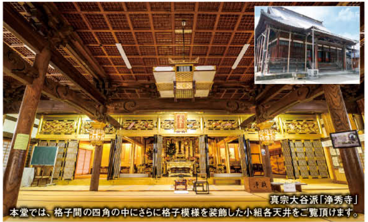
真宗大谷派「浄秀寺」 本堂では、格子間の四角の中にさらに格子模様を装飾した小組各天井をご覧ください。