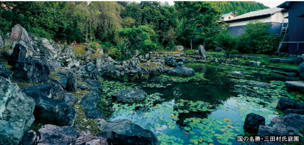
国の名勝・三田村氏庭園