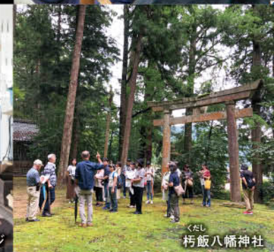
くたし 朽飯八幡神社