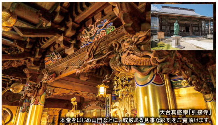
天台真盛宗「引接寺」 本堂をはじめ山門などに、威厳ある見事な彫刻をご覧ください。

建築の専門家と一緒に、宗派の異なる二つの寺院を巡り、それぞれの寺院建築に触れます。