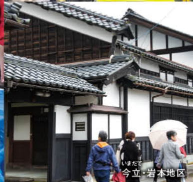
いままで 今立・岩本地区