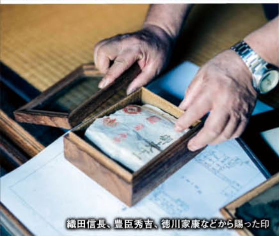
織田信長、豊臣秀吉、徳川家康などから賜った印