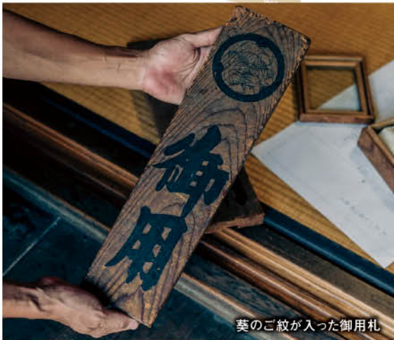
葵のご紋が入った御用札