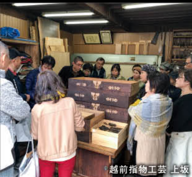
越前指物工芸 上坂

古い歴史を誇る越前市は、「越前和紙」「越前打刃物」「越前草笥」の3つの伝統的工芸品を今に受け継ぐ「手仕事のまち」です。市内を散策すると、産業の発展とともに形成された町並みや文化、人に出会えます。お寺やお社、古い路地、看板、蔵など、昔ながらの懐かしい景色のなかには、ゆっくりと積み重ねられた人々の暮らしを垣間見ることができます。「手仕事のまち歩き」は、そんな人の手で時間をかけて創り伝えられてきた越前市の心、日本の心に触れるまち歩きです。