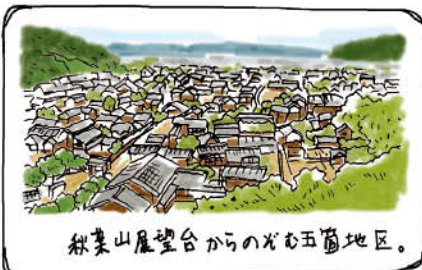
秋葉山展望台からの眺む五箇地区。