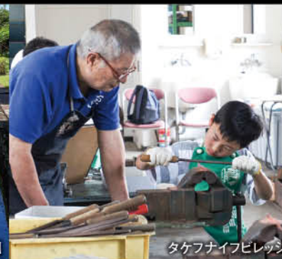
タケフナイフビルド